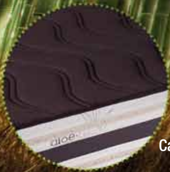
Cara de verano