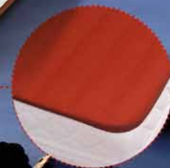
Cara de verano